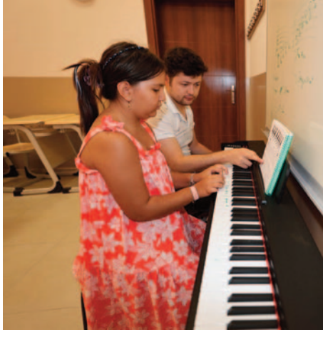
çarşamba, perşembe, cuma ve cumartesi günleri düzenlenecek eğitim-

Şehzadeler Belediyesi tarafından 7 yaş ve üzeri vatandaşlara yönelik olarak planlanan kurslar, haftanın altı günü gerçekleştirilecek. Pazartesi, salı,