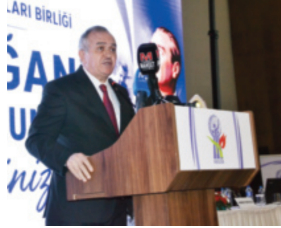
29. Olağan Genel Kuruluna katılan MHP Grup Başkanvekili ve Manisa Milletvekili Erkan Akçay, kongredeki konuşmasında esnafın ekonomideki

MHP Grup Başkanvekili Erkan Akçay, Manisa Esnaf ve Sanatkarlar Odaları Birliği'nin 29. Olağan Genel Kurulu'nda yaptığı konuşmada, esnafın ekonomik zorluklara rağmen ayakta kalma mücadelesi verdiğini belirtti. Akçay krediye erişimin önünün açılması, prim gün sayısının düşürülmesi ve enerji ile akaryakıtta esnafa özel tarifeler uygulanması gerektiğini söyledi.