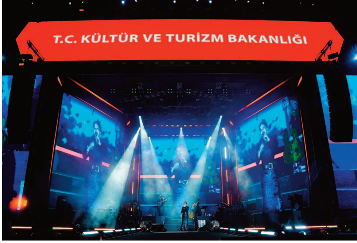
Gece boyunca enerjisini koruyan sanatçı, izleyicilerden tam not aldı.

Manisa Kültür Yolu Festivali'nin ikinci günü, ünlü sanatçı Bengü'nün konseriyle adeta müzik şölenine dönüştü. Perşembe Pazarı Otopark Alanı'nda gerçekleştirilen konserde binlerce vatandaş festival coşkusu doyasıya yaşadı. Festival kapsamında Manisalılarla buluşan Bengü, sahneye çıkmasıyla birlikte alanı dolduran hayranlarından büyük alkış aldı. Gece boyunca sevilen şarkılarını seslendiren sanatçı, sahnedeki enerjisi ve performansı izleyicilere unutulmaz anlar yaşattı. Konserde "Gezegen", "Korkma Kalbim" ve "Saygımdan" başta olmak üzere en sevilen eserlerini seslendiren Bengü'ye binlerce kişi hep bir ağızdan eşlik etti. Şarkılarla birlikte festival alanında coşku doruğa çıkarken, renkli görüntüler oluştu. Sahne performansı ve güçlü yorumuyla büyük beğeni toplayan Bengü, festivalin ikinci gününe damga vurdu.