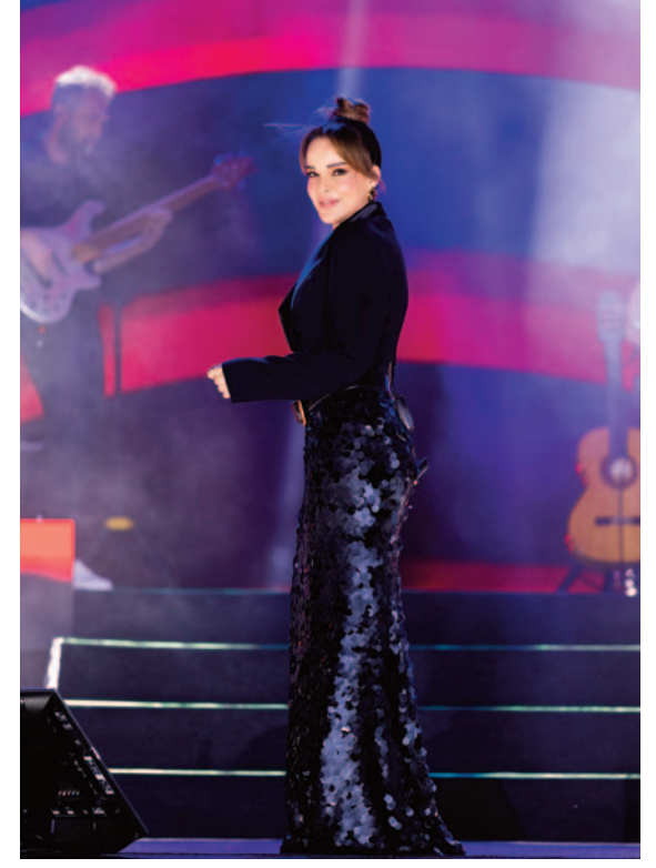
unutulmaz anlara sahne olurken, festival coşkusu da zirveye taşıdı. İHA