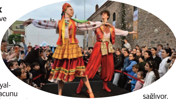
sağlıyor. AKHISAR VE

Manisa'nın en köklü organizasyonu olan ve bu yıl 486'ncısı düzenlenen Mesir Macunu Festivali her yıl yüz binlerce ziyaretçiyi ağırlarken, ilçelerde düzenlenen festivaller de turizm açısından hareketlilik sağlıyor. Gölmarara'da bu yıl haziran ayında ikincisi düzenlenen Bağ Yaprığı Festivali, ilçenin ekonomik değerlerinden biri olan asma yaprağının tanıtımına katkı sunarken, Sarıgöl'de Eylül ayında 18'inci düzenlenecek olan Sultanî Üzüm Festivali ise ilçenin en önemli tarımsal ürünü olan üzümün tanıtımına katkı