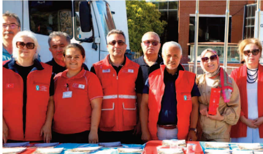
gerçekleştirdik. Başta Kızılay Manisa Şubemiz olmak üzere dernek üyeler-